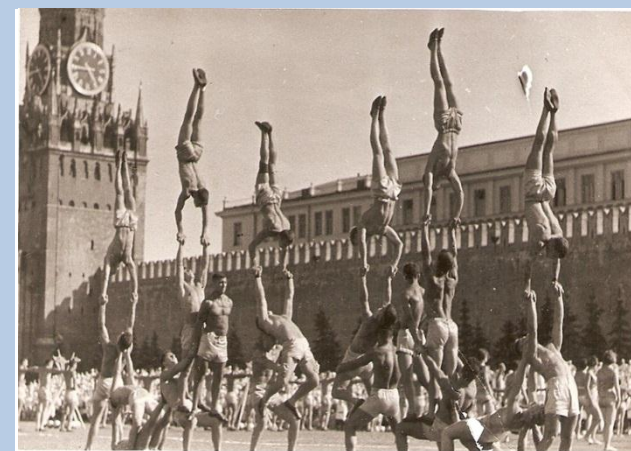
Сайт бесплатных объявлений ПроПокупки (ProPorky.ru)

Правительству СССР хотелось зрелищности, демонстрации сильного и развитого советского человека как надежного защитника страны, поэтому в подготовке и проведении парадов участвовали известные режиссеры, художники-оформители, балетмейстеры и костюмеры. Результаты их работ были впечатляющими – парад физкультурников превратился в яркое театрализованное зрелище. Зрителей поражало единообразие внешнего образа, синхронность, точность и ритмичность движений участников.